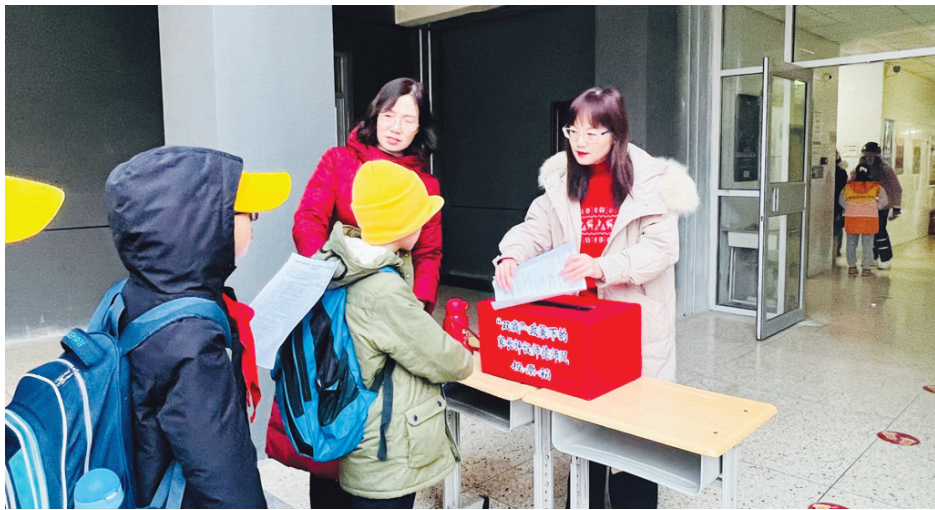
一月七日,并州路小学开展师德师风家长问卷调查活动,进一步加强家校沟通,促进学校师德师风建设。