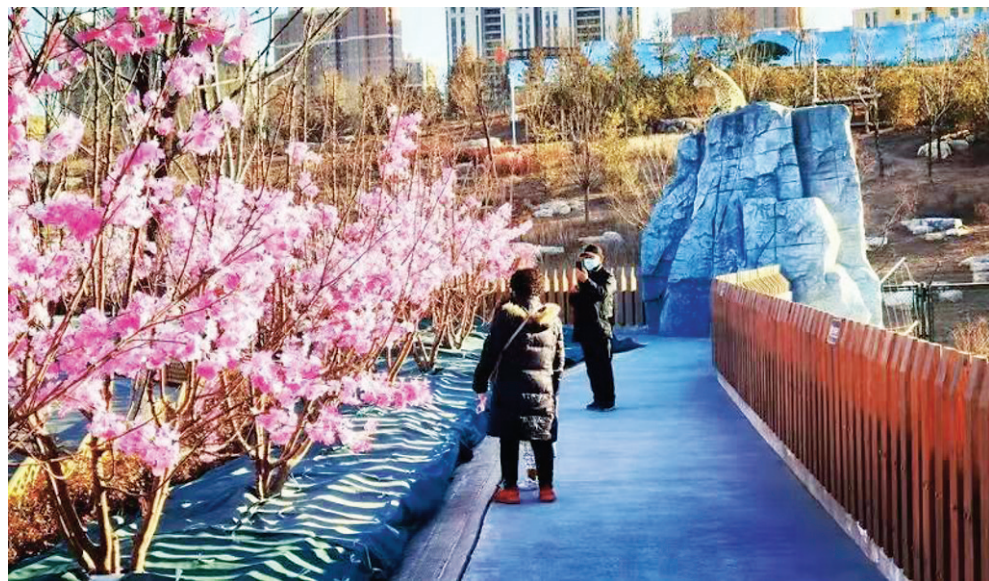
为增添冬季景观效果,喜迎新春佳节,太原动物园新近购入了万余株仿真花卉,装点公园入口、牡丹园、熊猫馆、大象馆、虎园等游客聚集处,姹紫嫣红的“春景”引得游客纷纷驻足拍摄。

临走时,老两口对三名社区干部深表谢意,大家把手机号都留给老人,表示社区工作人员都是24小时开机,家里有任何突发事都可以第一时间和他们取得联系,他们会及时提供帮助。