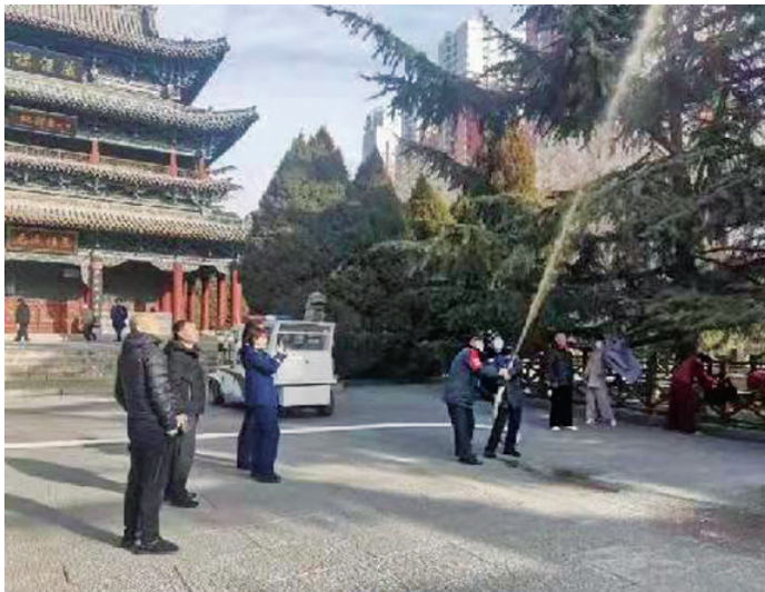
保障春节游园安全

票权,想要增加抢票成功的几率,还是得通过12306官方渠道里的候补功能。 警方提醒大家,一定要通过正规渠道订票,勿信“低价票”“折扣票”等虚假信息,更不要从陌生人手买票;收到好友帮忙购买机票等信息时,一定要多方核实情况,不向陌生账号转账汇款;收到航班延误、取消短信时,不要直接联系短信里提供的电话号码,应向航空公司官方客服或机场工作人员询问;退票、退款时,不需要输入密码和验证码,更不需要先行汇款;不轻易点击陌生链接,切勿泄露个人信息,特别是银行卡账号和密码等。