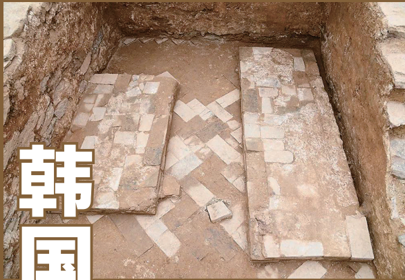
出土中国造墓砖的陵墓