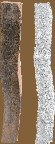
韩国王陵出土的墓砖,刻有汉字