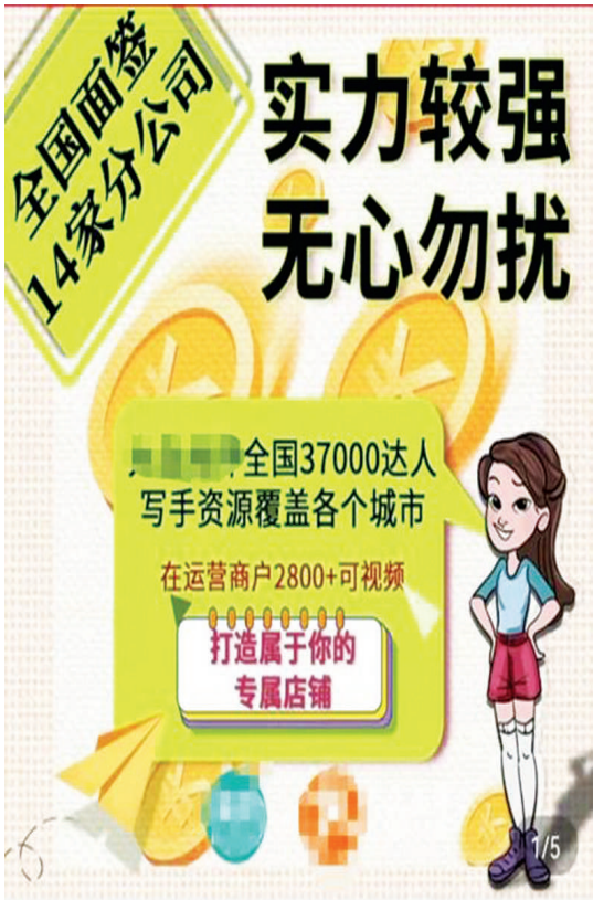
购物网站上某第三方机构的刷分控评广告。