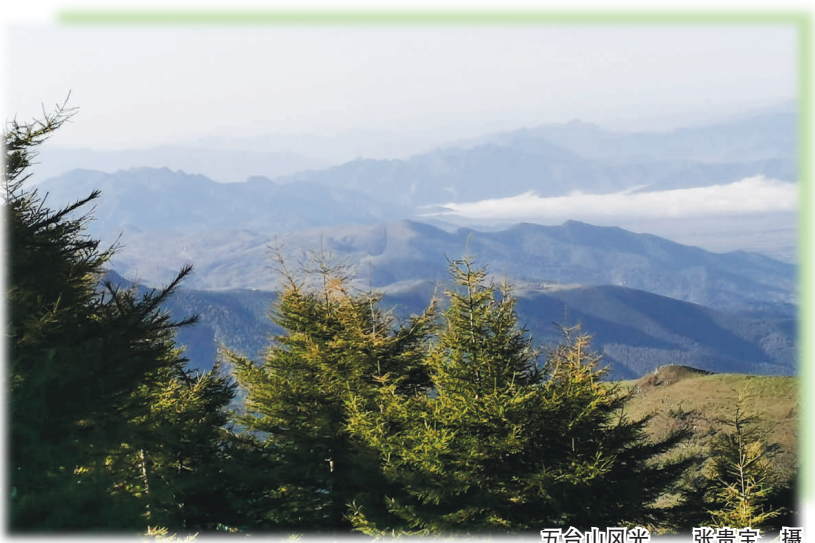
五台山风光

恒山北麓泉水甚多,有一泉名为“甘泉”,清澈透明,绵甜爽口,含钙盐极少。俗话说,“佳酒必有佳泉”,著名的“恒山老白干”便是以甘泉之水为酿造用水而成。“恒山老白干”始产于明代,盛产于清代,当时民间传有“吸水烟到兰州,喝烧酒浑源州”的谚语。民间将恒山白酒与恒山黄芪、恒山悬空寺并称恒山“三绝”。