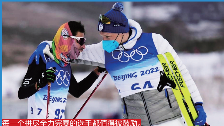
每一个拼尽全力完赛的选手都值得被鼓励。

2月8日，谷爱凌（右）夺得冠军后，上前安慰获得银牌的法国选手。并表示：因为有了她的高水平发挥，自己才能用于挑战高难度动作。