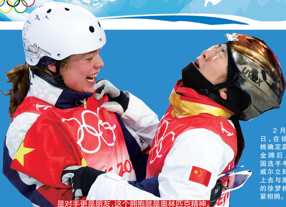
是对对手更是朋友，这个拥抱就是奥林匹克精神。

她们以无所畏惧的拼搏，无私的热情拥抱，诠释了“更快、更高、更强——更团结”的含义。这个拥抱跨越了种族、国籍，无需更多的语言，拉近了彼此的人生。