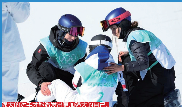
强大的对手才能激发出更加强大的自己。

2月8日，谷爱凌（右）夺得冠军后，上前安慰获得银牌的法国选手。并表示：因为有了她的高水平发挥，自己才能用于挑战高难度动作。