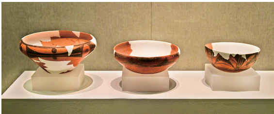
彩陶钵(新石器时代)