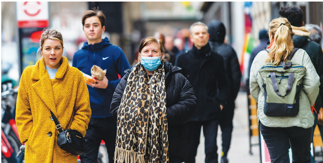
2月21日,人们行走在英国伦敦街头。