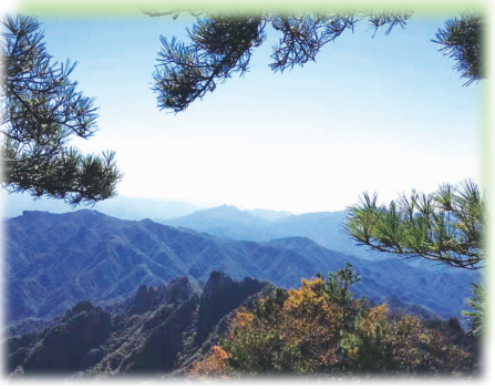
右手一指是吕梁——吕梁市交城县关帝山

俗语说:“黄河古道十八湾,龙门一湾到潼关。”汾河是山西最大的河流,是山西的生命线。沁河是山西第二大河,此外还有涑水河、桑干河、滹沱河、漳河等。