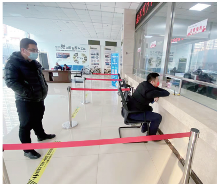
▼ 办事严格执行“一米线”

严格落实交通场站、医院、学校、商超、酒店、餐饮、市场、娱乐场所等重点场所疫情防控各项措施,各级各类学校要加强返校师生健康管理和监测,落实高校封闭管理和中小学生对点管理要求。医疗机构要加强预约诊疗、分时段就医、线上咨询、慢病处方等医疗管理,有效分流患者,避免人员大量聚集。重点加强“第一落点”管控,强化交通卡口疫情防控查验机制,机场、火车站、汽车站要加强省外返(抵)晋人员排查,严格按照要求查验48小时内核酸检测阴性证明和行程卡。