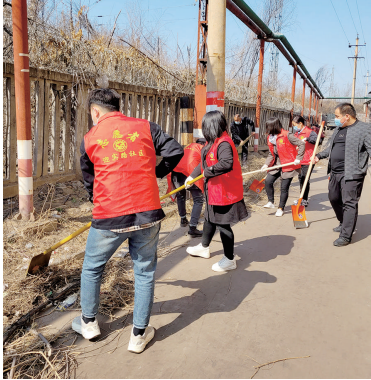
志愿者清理社区卫生。

本报讯(记者 刘志刚 通讯员 赵雅瑞 康春燕 文/摄)清理卫生死角,清运建筑垃圾,清除杂草杂物,铲除小广告……连日来,古交市西曲街道各党支部发挥基层党组织战斗堡垒作用和党员先锋模范作用,带领党员志愿者进社区、入农村,清洁环境,防控疫情,为创城助力,让越来越多的居民感受到“西曲温度”。 4月1日,迎宾路社区党支部书记带领党员志愿者下沉网格,开展志愿服务活动。大家手拿扫帚、铁锹集中清理了铁路宿舍楼院的卫生死角。其间,不断有居民拿起自家的工具也加入进来。 “铁路宿舍属于老旧小区,背街背巷的陈年堆积物多,非常杂乱,这次得到彻底清理,真是太好了!”居民张阿姨高兴地说。张阿姨是老党员,每次社区组织的活动她都准时参加,这次志愿服务活动,她也加入其中。 在文明城市创建中,西曲街道各党支部利用主题党日活动,召集党员、入党积极分子、群众志愿者,在各自辖区捡拾垃圾、清洁楼道,并引导居民出行佩戴口罩、不乱扔垃圾、不随地吐痰,保持良好的个人卫生习惯,杜绝不文明行为,为文明城市创建尽一份心、助一份力。