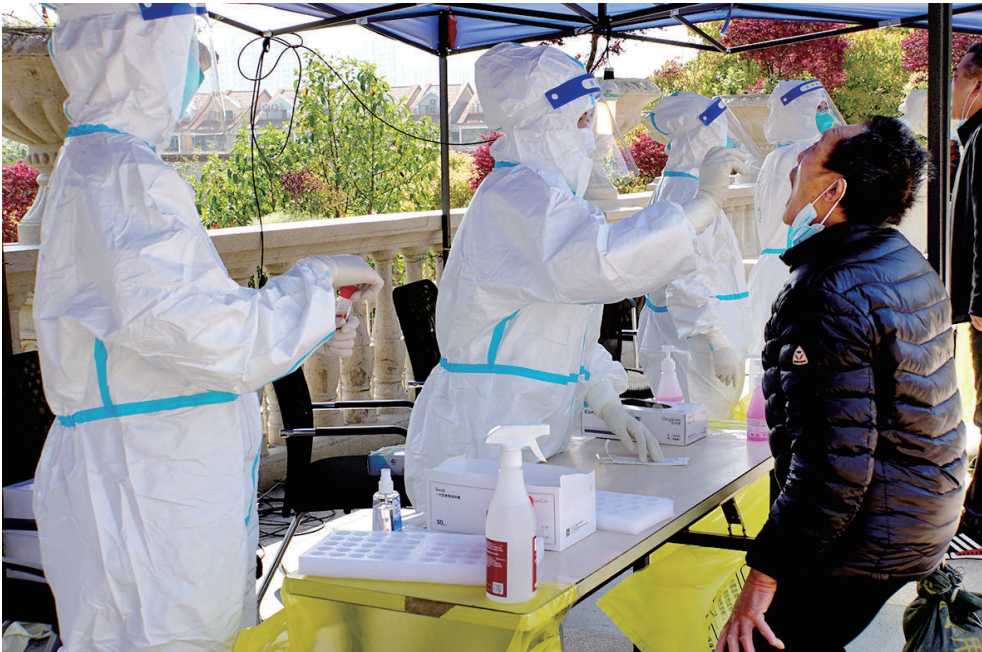
4月6日,在上海嘉定区南翔镇一小区内,来自海南的援沪医务人员在为居民进行核酸检测。

在中央和兄弟省份的强力支持下,目前上海单日最大核酸检测能力达到400万管。全市共设置了约2万个采样点,组织了约5万名采样人员。同时,上海还加强“采、运、检、报、核”各环节衔接,压缩样本运送时间,保障检测能力满负荷运转,提高结果报送效率,努力做到快采、快运、快检、快报、快核。