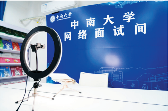
中南大学为学生布置的网络面试间设备齐全。