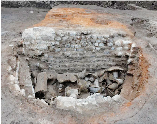
晋阳古城二号窑炉(东-西)