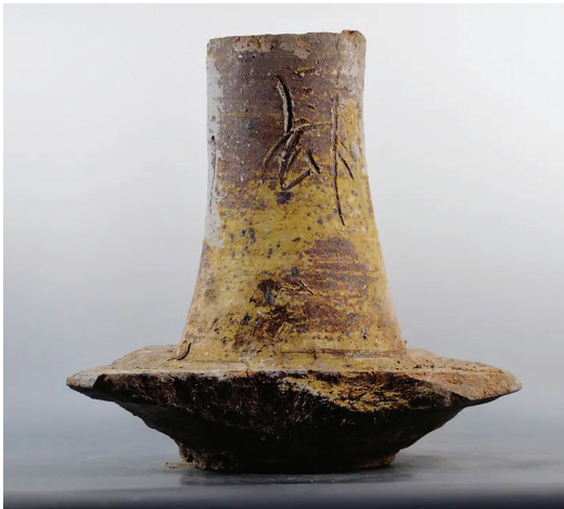
蘑菇形窑柱