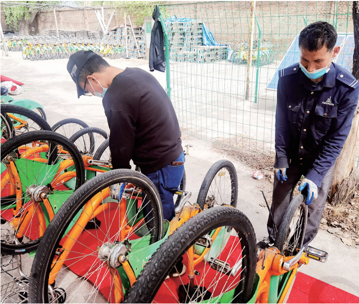
4月20日上午,长风公交停车场,这里是太原公共自行车公司二车队的集中保养点,大量公共自行车被整齐地倒置在地面上,几名维修工人正在有序分工合作。4月20日起,全市4.1万辆公共自行车开始春季大保养。

本报讯(记者 李涛 通讯员 井宇豪 徐鹏飞)地铁2号线恢复运行后,乘坐地铁出行的市民日渐增多。4月21日,太原中铁轨道交通建设运营公司针对购票、乘车等环节,发布了一份“乘车安全小贴士”,市民乘坐地铁时请留意。 乘客进入车站后,应面向扶梯运行方向,靠右站好站稳,切勿做倚靠、逆行等危险动作。紧急情况下,可立即按压急停按钮。急停按钮位于电动扶梯上下两端,超长扶梯中间也有一处。携带大件行李、行动不便等乘客,请优先选择垂直电梯。 到达站厅,请大家间隔一米排队购票。建议前往自助售票机自助购票,可减少购票时间。在通过检票闸机时,请在黄线外侧,在右侧感应区刷卡。如果所站位置不合适,很可能无法检测开门。出站时,请将单程票插入回收口。 在候车时,请在安全线外候车,否则列车开关门时影响站台门正常开启,且可能威胁人身安全。当列车的灯闪烁时,请勿抢上抢下。发生紧急情况时,可按压站台侧紧急停车按钮。需要注意的是,无故擅自操作紧急停车按钮,要负法律责任。