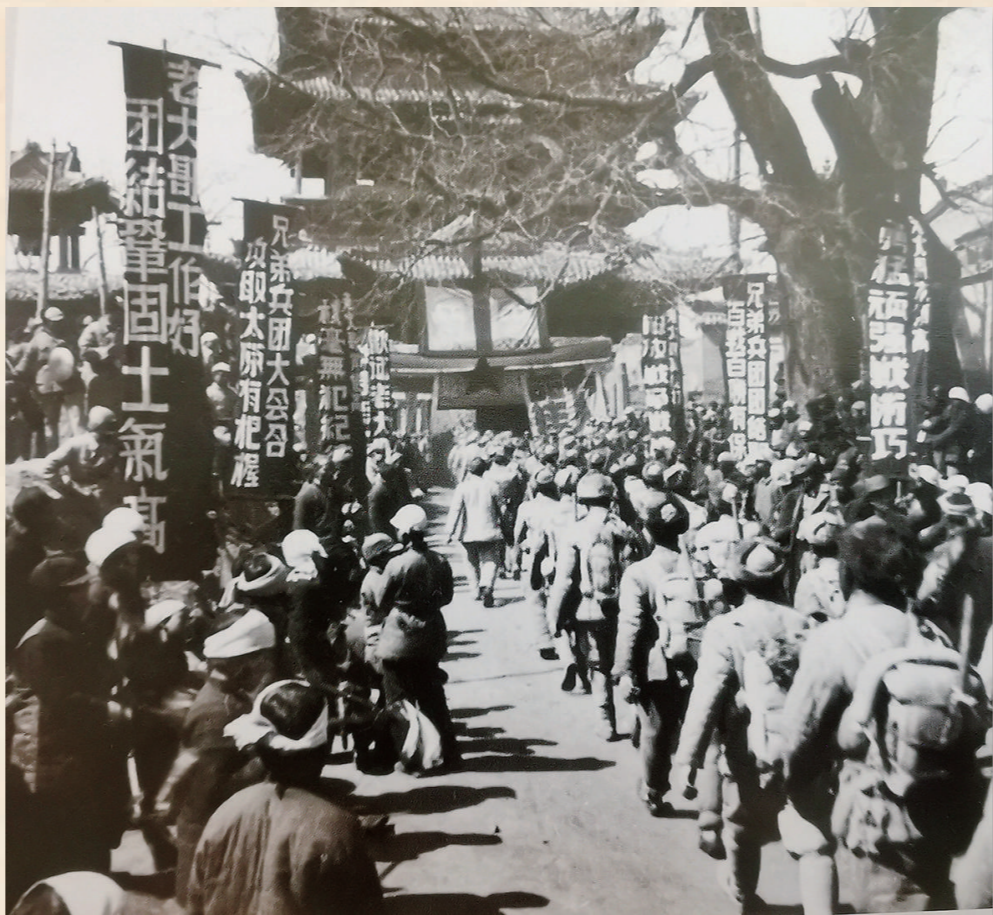
华北军区三大主力兵团齐聚太原前线。

今天我们早已远离战火纷飞的时代。但正如习近平总书记所说:“长期过着和平生活,最容易患上理想信念缺失的‘软骨病’。”越是平时时期越要学习党的历史,用好红色资源,牢记初心使命,永葆共产党员的政治本色。太原解放战役是太原地方党史上的一个标志性事件,也是党的历史上的重要事件,代表着我们党走过的一段光辉历程,形成了代代承载着我们梦想和追求、情怀和担当、牺牲和奉献的红色资源,汇聚积淀成英雄太原的红色血脉,是我们奋进新时代的力量源泉。我们要运用好解放太原形成的红色资源,赓续红色血脉,牢记领袖嘱托,全方位推动高质量发展,创造无愧于革命先辈、无愧于历史和人民的新业绩。(执笔:杨云龙、张楠)