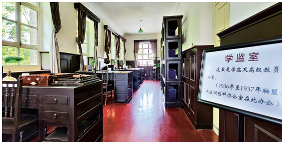
原状展陈的学监室