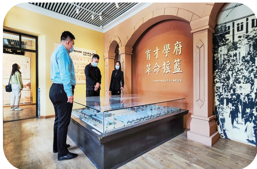
“育才学府 革命摇篮”序厅

历史的足音，从未走远，依旧铿锵，依旧豪迈；先辈的功绩，从不褪色，光耀后人，阔步未来。