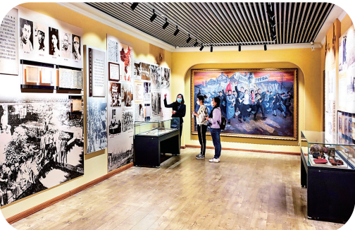
“建立统一战线 奋斗牺牲救国”展厅