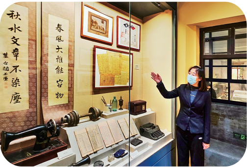
“创建国民师范 普及国民教育”展厅