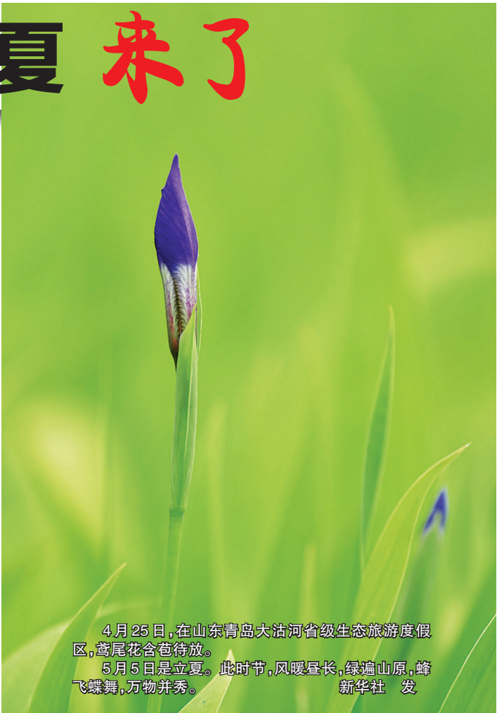
4月25日，在山东青岛大沽河省级生态旅游度假区，鸢尾花含苞待放。 5月5日是立夏。此时节，风暖昼长，绿遍山原，蜂飞蝶舞，万物并秀。