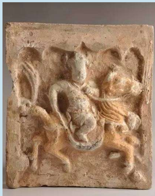
马球彩绘浮雕画像砖。

围棋古称“弈”,相传是为尧帝所发明。传说尧的儿子丹朱顽劣,尧发明围棋以教育丹朱,陶冶其性情。到了春秋战国时期,围棋已在社会各阶层当中广为流行。特别是在唐代,政府中专门设立“棋待诏”这样的官职,用以招揽国内(甚至包括国外)的围棋高手,足见当时人们对于围棋的喜爱和重视。