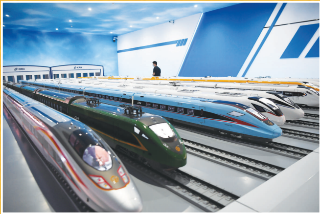
5月18日,广州铁路博物馆正式对外开放。博物馆在百年老站黄沙沙站的原址上修建,保留了铁路车站老建筑的基本风貌。图为高铁列车模型。