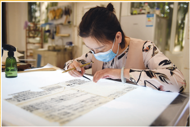
安徽博物院文物科技保护中心承担馆藏文物的保护工作,是博物院内的“文物医院”。几十年来,一件件残缺破损的文物经过他们的专业修复处理后,重回“颜值巅峰”。图为工作人员对古籍文物进行补全。