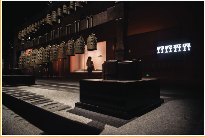
“稣:音乐的力量——中国早期乐器文化”在湖北省博物馆正式开幕,来自全国7个省(市)、15家文博机构的百余件(套)音乐文物集中亮相。图为天星观2号墓编钟。