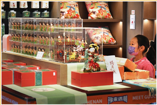
近年来,河南博物院文创团队设计开发了考古盲盒、棒棒糖、书签、冰箱贴等近1600款精美的文创产品,受到众多年轻人的追捧。图为一名小朋友在河南博物院文创商店内挑选文创产品。