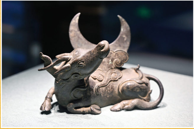
海南省博物馆推出“动物总动员——馆藏动物文物展”,从馆藏文物中精选150余件(套)动物文物展出。图为清代犀牛望月铜镜架。