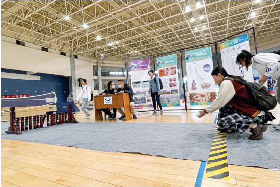
一位大学生在体验传统体育运动木射。