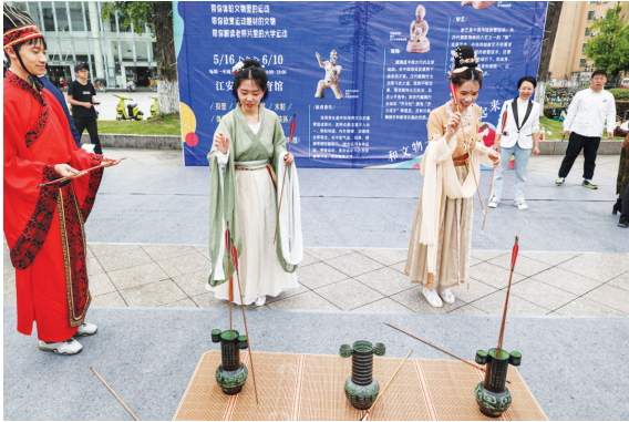
学生身着汉服体验传统体育运动投壶。