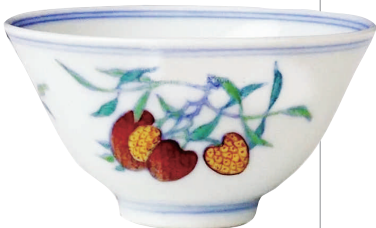
清斗彩三果纹小杯