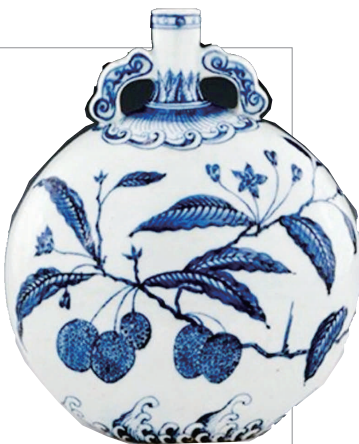
明青花荔枝纹如意耳抱月瓶

三果纹的构图方式较为固定,或为单纯的三果,或为折枝三果,多为散点式布局。明代宣德官窑三果纹饰较为常见,对于后世产生了较大的影响。清代官窑瓷器上的三果纹画必有意,意必吉祥,寄托着祈望多子、多福、多寿的美好愿望。