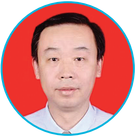
太原市人民医院胸外科专家