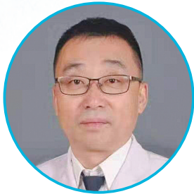
太原市人民医院骨科专家