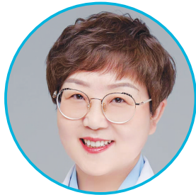
太原市人民医院中医科专家