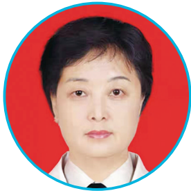
太原市人民医院内分泌科专家

出诊时间:每周一全天 出诊地点:本部门诊二楼妇产科诊室 出诊时间:每周四全天 出诊地点:晋源院区门诊二楼名医工作室