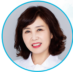
太原市人民医院妇产科专家