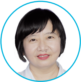
太原市人民医院内分泌科专家