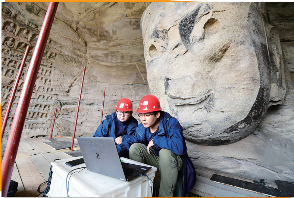
5月11日,在云冈石窟第17窟,工作人员在分析采集到的石窟数据信息。