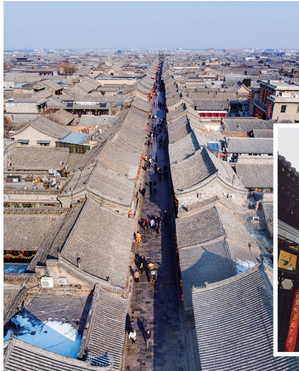
◀ 2月8日拍摄的平遥古城一角。