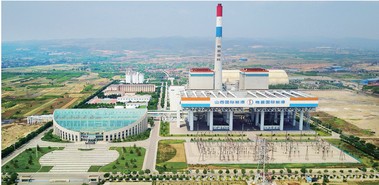
山西瑞光热电有限责任公司一角。