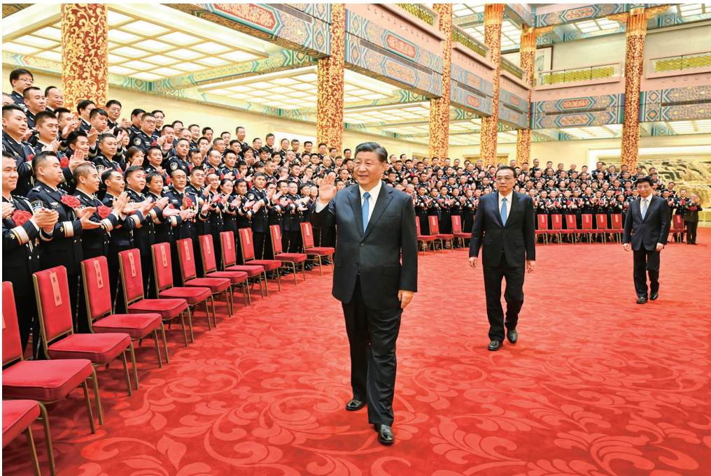
5月25日，党和国家领导人习近平、李克强、王沪宁等在北京人民大会堂会见全国公安系统英雄模范立功集体表彰大会代表。