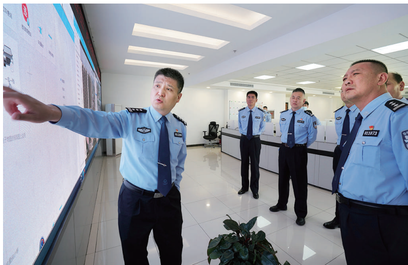
图为综改大队领导通过可视系统查看辖区路况。

为预防渣土车等重点车辆夜间违法引发事故,综改大队在管委会支持下,免费向在综改区作业的重点运输企业推广重点车辆管理系统。这种系统能自主发现司机疲劳、超速、闯红灯等违法行为,还能在发现违法后,发出预警,并采集违法画面录入系统。