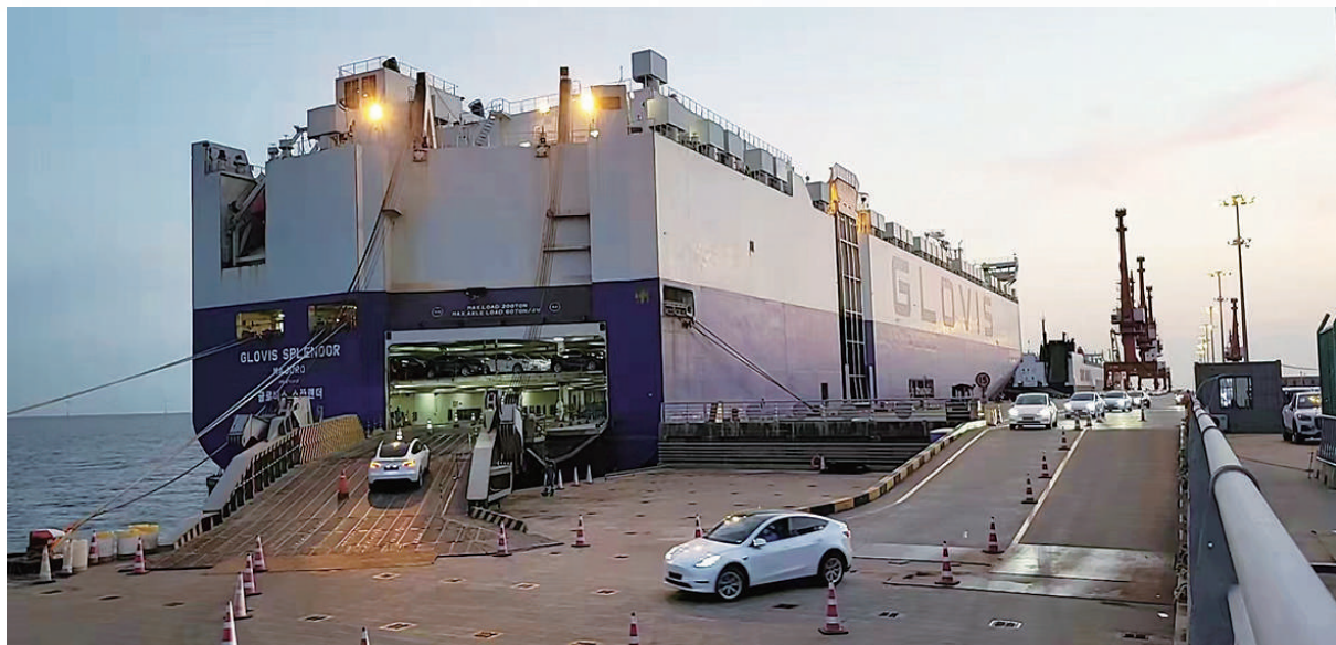
5月11日在上海南港码头拍摄的特斯拉电动汽车装船现场。这是特斯拉上海超级工厂复工复产后首批次整船出口。

进入5月,上海沿街的梧桐树枝叶茂盛。紧锣密鼓复工复产的工厂园区繁忙有序,陆续恢复往日的生机。