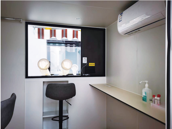
采样舱内部整洁舒适。