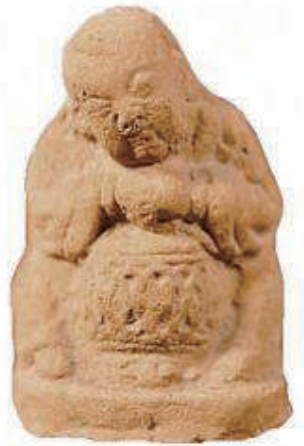
“磨喝乐”童子像 常州博物馆藏