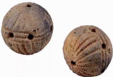
新石器时代 陶响球 湖北省博物馆藏