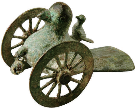
汉 铜鸠车 河南新郑博物馆

敦煌佛爷庙湾36号魏晋墓中出土的一幅砖画,内容正是儿童骑竹马。这幅砖画可能是最早的关于这个题材的图像。画面中间一小孩右手握着一根竹子骑在胯下,左手抓着母亲的手,整个画面以儿童骑竹马为中心,欢快温馨。