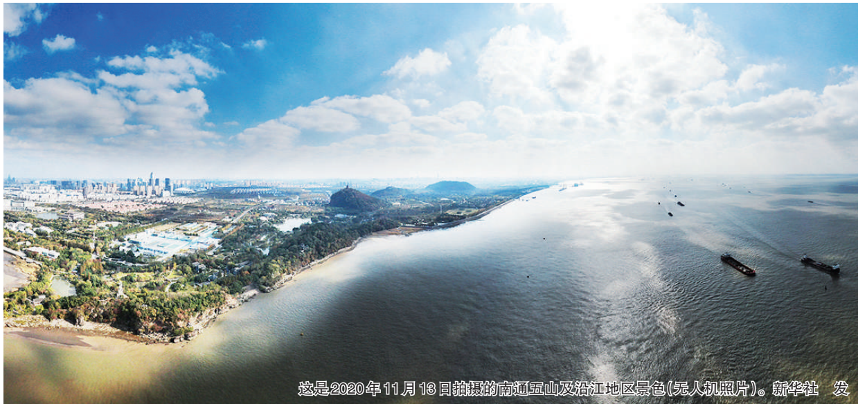
这是2020年11月13日拍摄的南通五山及沿江地区景色(无人机照片)。

江苏始终沿着总书记指引的方向，全面把握新发展阶段的新任务，以创新举措贯彻新发展理念，争做经济“压舱石”、改革“探路者”、开放“新窗口”、发展“新标杆”，砥砺初心开创社会主义现代化建设新局面。