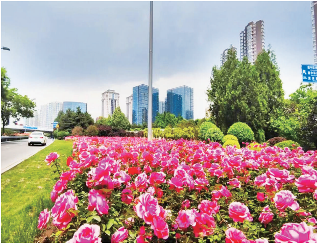
滨河东西路上月季花开正艳,一片姹紫嫣红。

本报讯(记者 刘晓亮 文/摄)近段时间,滨河东西路、长风大街等市直道路上数十万株月季陆续开放,姹紫嫣红、浓艳芬芳,极大地丰富了我市夏季的景观色彩,吸引了南来北往的市民驻足观赏,成为我市一道靓丽的风景线。 据了解,由于月季适合北方气候,且花色绚烂、抗性强,近年来,我市持续加大月季栽植力度,在滨河东西路、长风街、龙城大街、解放路、新建路等处先后栽植了216万余株色彩丰富、形态各异的月季,打造了多条月季特色道路。月季花期长达半年之久,从5月开放,到6月、7月、8月进入盛花期,一直可持续到10月,深受市民的喜爱。今年,市道路养管中心在年初就制定了月季养护管理年度计划,经过园林工人的辛勤劳作,第一茬月季花已陆续开放,光谱、御用马车、安吉拉、粉扇、绯扇等品种的各类月季争奇斗艳,景观效果突出且持续,逐步形成了繁花似锦的月季景观长廊。 下一步,该中心将不断提高月季养护管理水平,持续推进国家生态园林城市创建工作,力争将滨河东西路、迎泽大街、长风大街等市直道路打造成整齐美观、色彩缤纷的花卉景观精品示范大道。