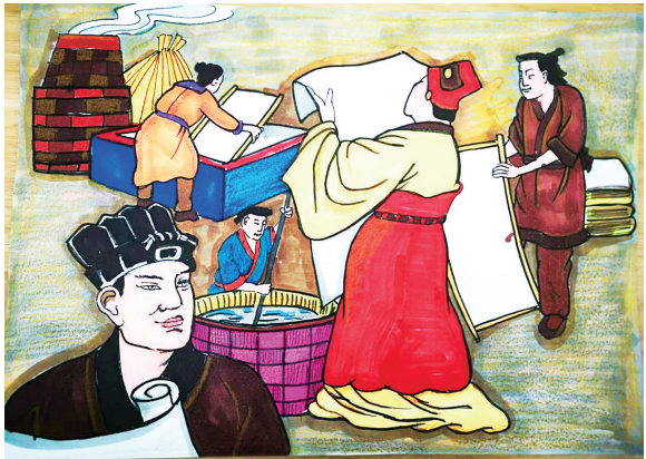
《语文》三年级下册《纸的发明》 三年四班 赵书香 绘