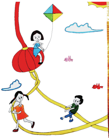
《语文》三年级下册《传统节日》 三年二班 姬雯好 绘