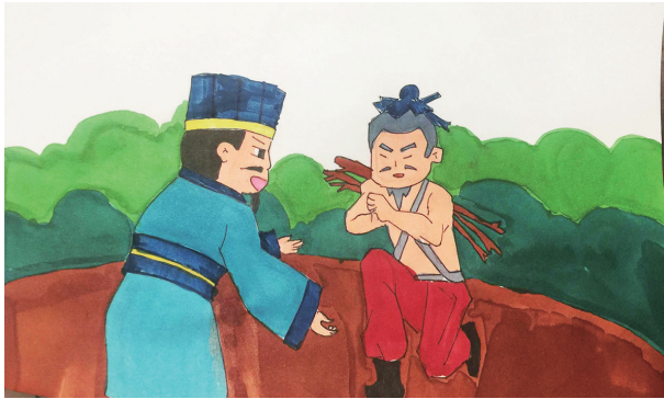
《语文》五年级上册《负荆请罪》 六年五班 温卓苒 绘