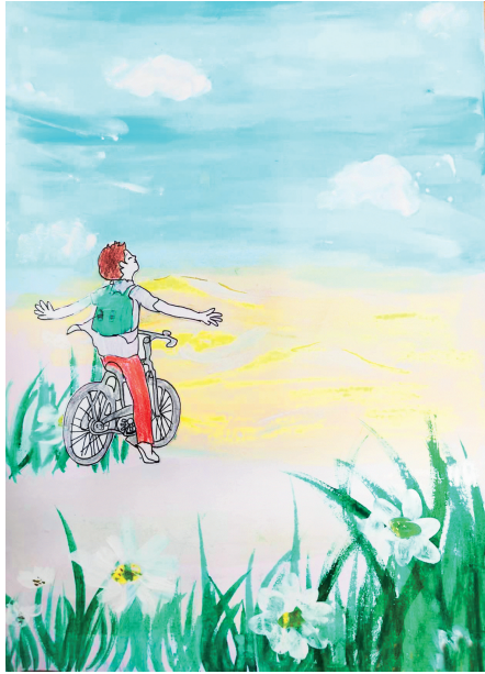
《语文》六年级下册《我为少男少女们歌唱》 六年五班 赵弋萱 绘