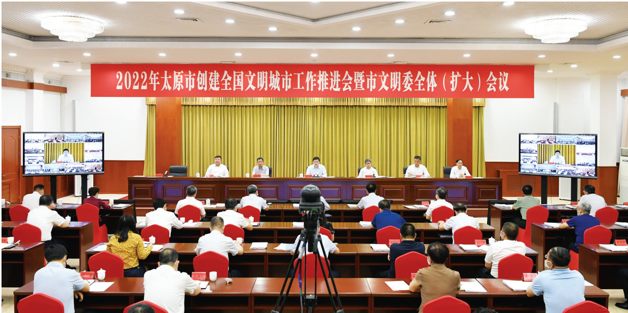
2022年太原市创建全国文明城市工作推进会暨市文明委全体(扩大)会议会场。

韦韬强调,今年是本届创城承上启下、巩固提升的关键之年。必须以背水一战的决心、尽锐出战的态势,扎实推进创建全国文明城市各项工作。要坚持全域创建。按照由点到面覆盖、由城向村延伸、由区向县发展的工作思路,高标准做好实地点位及周边的基础建设、环境卫生、管理秩序等工作,大力推进农村人居环境整治、“厕所革命”、移风易俗等工作,