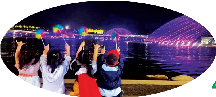
▲ 华灯初上,美景、儿童相映成趣。