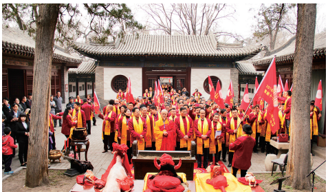
太原海外王氏后援会