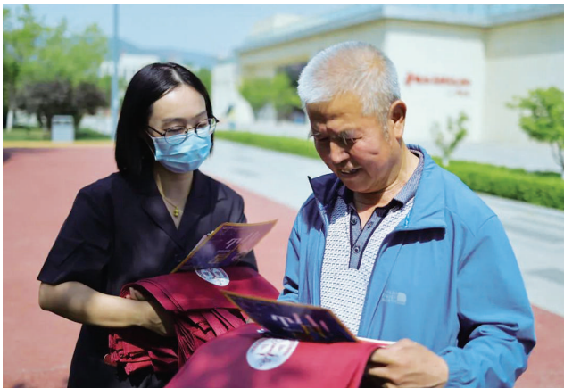
尖草坪区法院干警在金桥公园开展普法宣传活动。