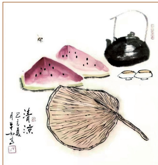
清凉 牛力 绘

凤仙花还是一种中草药，凤仙花的根、茎、叶、花、种子都是中药。全草名为透骨草，入药有活血化瘀、利尿解毒、通经透骨的功效。种子名急性子，为解药毒，有通经、催产、祛痰、消积块的疗效。花汁有杀霉菌、癣菌的功能，可治疗顽固的甲癣、灰指甲等病症。