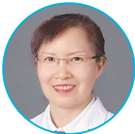
太原市人民医院肾病科专家

出诊时间:周一全天 出诊地点:本部门诊楼二层心内科专家门诊 出诊时间:周三全天 出诊地点:晋源院区门诊楼二层名医工作室心内科诊室