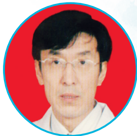
太原市人民医院心血管内科专家

出诊时间:周一、二、三上午,周四全天 出诊地点:本部门诊楼二层内科专家门诊6诊室 出诊时间:周五上午 出诊地点:晋源院区门诊楼二层名医工作室7诊室