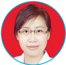
太原市人民医院风湿免疫科专家

出诊时间:周四全天 出诊地点:本部门诊楼二层妇产科专家诊室 出诊时间:周一上午 出诊地点:晋源院区门诊楼二层妇产科专家诊室