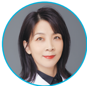
太原市人民医院口腔科专家

途经公交车:301路、310路、317路 晋阳大道贞观街口公交站382米 途经公交车:79路、301路、308路、310路、317路、318路、329路、856路 赤桥村公交站555米 途经公交车:79路、301路、308路、317路、318路、329路、856路 西镇公交站737米 途经公交车:Y2路 晋阳大道乾阳街口公交站740米 途经公交车:308路、310路、329路 晋祠公园公交站1.3公里 途经公交车:79路、301路、308路、317路、318路、319路、329路、Y2路、804路、856路、911路 晋阳大道进贤街口公交站1.2公里 途经公交车:308路、310路、317路、318路、329路 贞观街万福路口公交站1.0公里 途经公交车:79路、301路、310路、317路、318路、856路 小站营公交站2.1公里 途经公交车:311路、319路、804路、905路、908路、K905路 地铁→公交:地铁2号线→301路、317路、79路