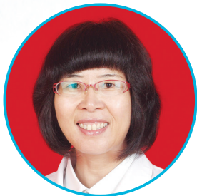
太原市人民医院妇产科专家