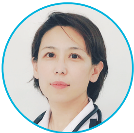
太原市人民医院急诊医学科专家

出诊时间:周一、四上午 出诊地点:本部门诊楼二层内科专家诊室 出诊时间:周二全天 出诊地点:晋源院区门诊楼二层名医工作室