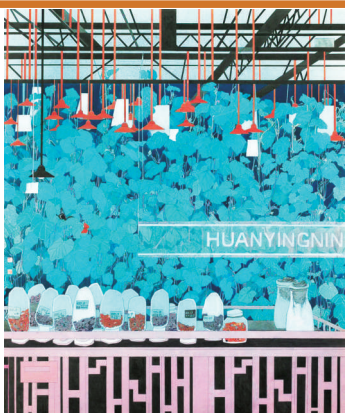
上图: 筑梦兴农(中国画) 王晓霞