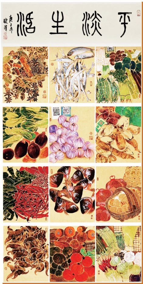
平淡生活(中国画) 付小青

我国近年来饮食题材绘画中,美术工作者正将目光从对“物”的美学礼赞,转向对“人民”及“时代”的深情关注。这些作品在研析形式审美的同时,更注重体现视觉图像背后的社会意义,从而揭示出丰富而深刻的时代内涵。