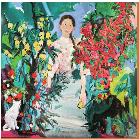
夏天的声音(油画) 孙洪敏