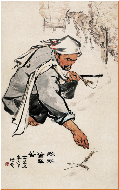
粒粒皆辛苦(中国画) 方增先