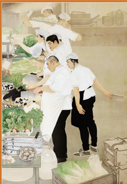
尖峰食刻(中国画) 陈治 武欣

厉行节约、反对浪费,美术工作者不仅以画笔真实记录生活,还以实际行动发出倡议。透过一件件美术作品,勤俭节约、艰苦奋斗的传统美德得到更加广泛的传扬,艺术之美与文明之美交相辉映。