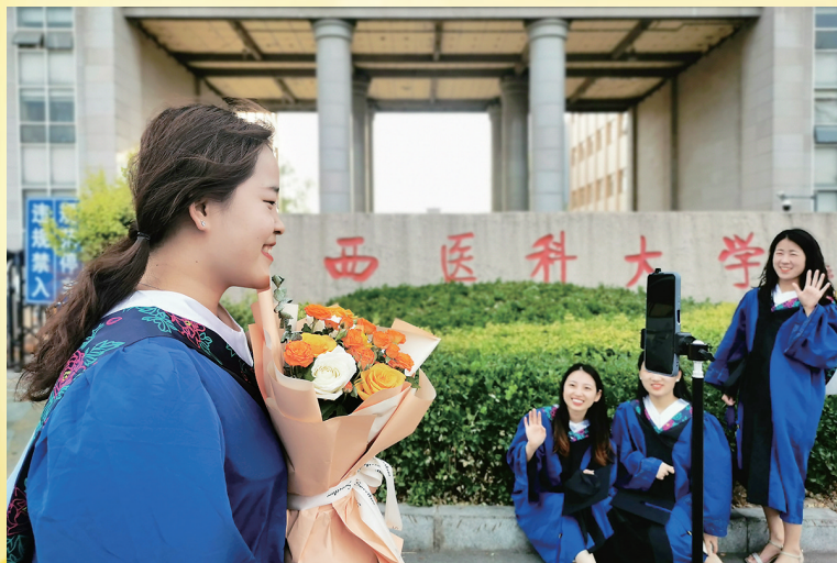
6月21日,山西医科大学的毕业生正在用网络直播的方式,记录校园美好生活,留下美好青春回忆。