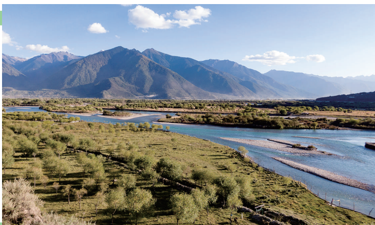
林芝市雅尼国家湿地公园。