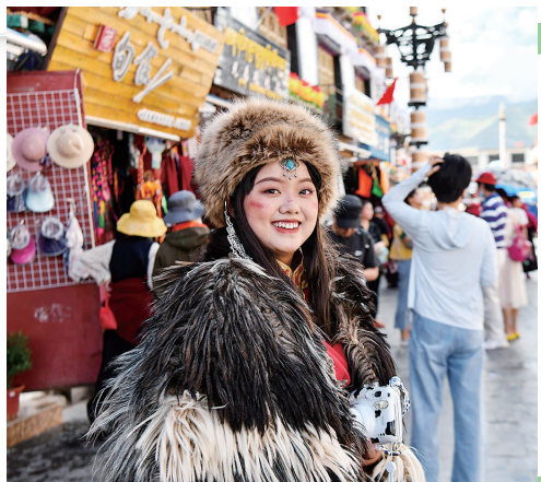
一名游客在八廓街拍照留念。