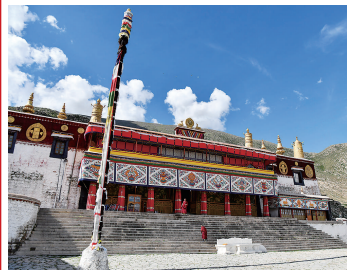
哲蚌寺外景(2021年7月22日摄)。