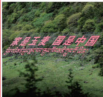
玉麦乡山坡上的标语(6月1日摄)。