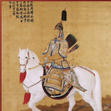
郎世宁 清乾隆二十三年 《乾隆帝盔甲骑马图》

本展览精心挑选35件晋、唐、宋、元书画,从艺术、文化、历史等角度,探究它们千古流芳的原因。展览共分三期,每期展出10件珍品,轮换展出。