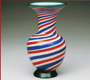
乾隆款彩色玻璃螺旋纹撇口瓶

宫廷人物肖像中有一类专用于祭祀典仪,风格雍容华贵、庄严肃穆,记录了皇室成员的面容、气质,以及彰显其身份地位的服饰。本展展出的几代帝后之朝服像,代表清宫最高规格人物肖像的艺术成就。