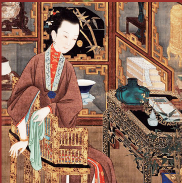
《博古思幽》 清康熙或雍正年间