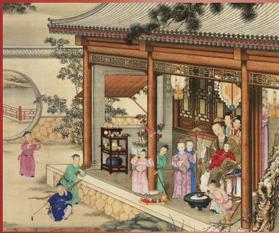
郎世宁 清乾隆元年至三年 《乾隆帝岁朝行乐图》

紫禁城建于北京中轴线上的地理位置,昭示了它在政治与文化上的中心地位。本展览通过100多件故宫典藏,介绍清代的紫禁城。