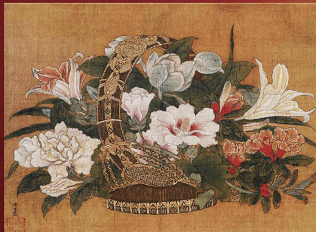
《花篮图》册页 李嵩 南宋

展览将邀请6位香港多媒体与跨界艺术家,以独到的视角,从香港当下的角度重新诠释和演绎故宫文化和收藏,发掘红墙黄瓦之下丰富多样的中国文化。