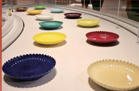
《十二色釉菊瓣盘》 清雍正年间

紫禁城是明清两代君主与后妃的主要居所,本展览主要透过300多件故宫珍藏的十八世纪精美文物,让观众了解紫禁城内从清晨到夜晚的生活点滴,探索城内人员丰富的物质与精神世界。