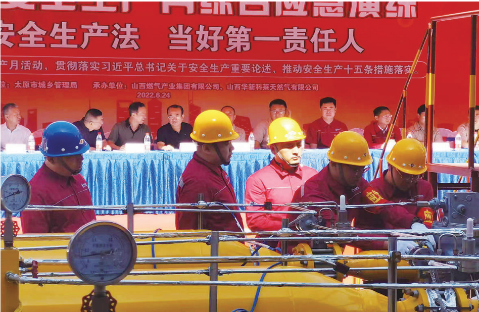
6月24日,山西国新科莱天然气有限公司在小店热源厂举行一次燃气泄漏事故应急演练。“科莱”调控中心接到报警后,立即启动应急预案。应急演练强化了燃气供应单位的应急抢险快速反应能力、救险保障能力、事故处置能力以及团结协作能力,确保燃气泄漏事故发生后能有效组织、快速反应、高效运转、临事不乱。