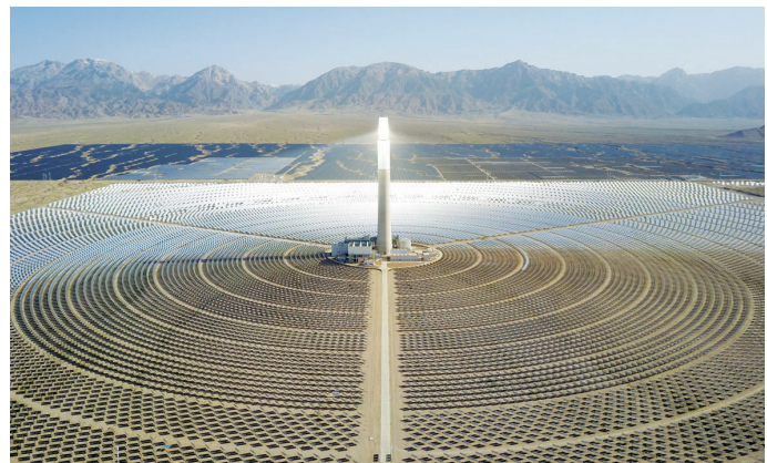
这是2022年6月8日在青海省海西蒙古族藏族自治州德令哈市光伏(光热)产业园拍摄的青海中控德令哈50兆瓦光热电站。