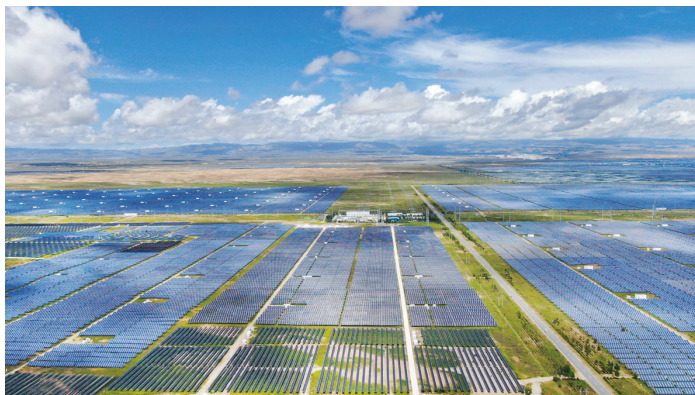
这是2020年8月17日在青海省海南藏族自治州共和县塔拉滩绿色产业发展园区拍摄的光伏电站(无人机照片)。