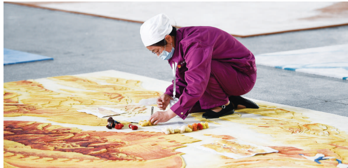
2021年6月7日,在青海圣源地毯集团有限公司生产车间内,工人在制作藏毯。