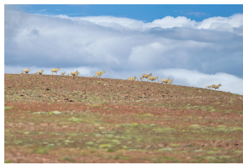
这是在可可西里卓乃湖区域拍摄的藏羚羊(2020年7月7日摄)。