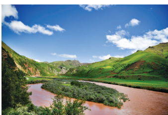
青海省玉树藏族自治州昂赛大峡谷风光。