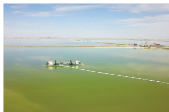
在青海柴达木盆地拍摄的察尔汗盐湖上的采盐船(无人机照片)。