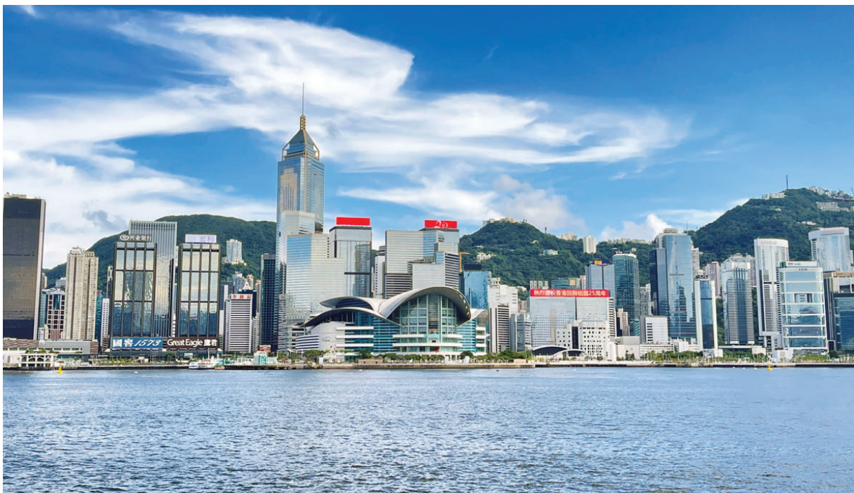
这是2022年6月25日拍摄的香港维多利亚港建筑。