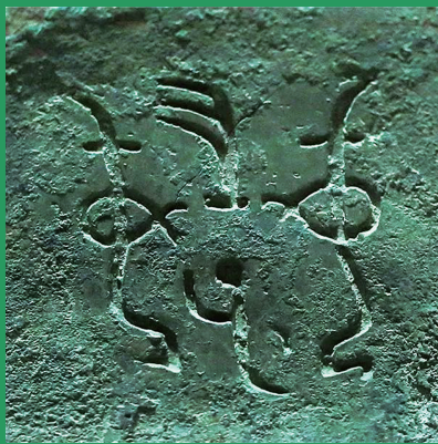
青铜器上的铭文「妇好」。