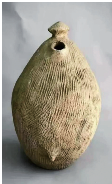
忻州晏村陶器嘬口罐。