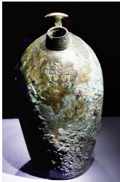
妇好墓出土的青铜嘬口罐。

近日，山西学者李琳之的著作《晚夏殷商八百年》，由研究出版社出版。书中他提出一个观点：妇好可能是山西忻州人。