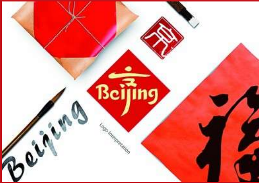
「北京礼物」标志与识别系统。