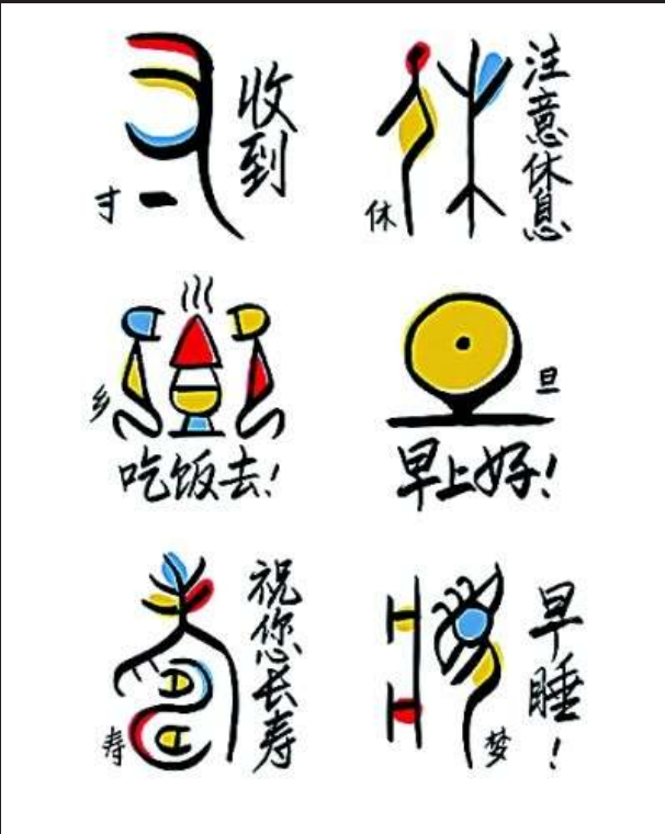
甲骨文表情包系列设计。

3 记者:近年来,许多艺术院校都设置了汉字设计的相关课程,您认为目前高校的汉字设计课程有何特色及不足之处?字体设计师应注重哪些方面能力的培养?