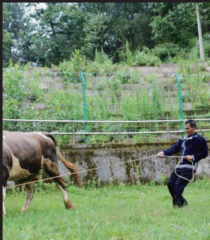
安子阿各在斗牛场训练牛