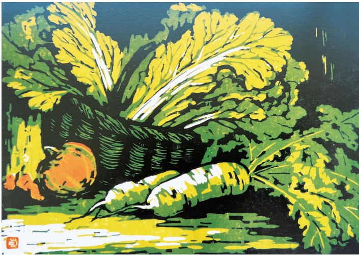
家常菜 套色木刻 肖晨刻

现如今,随着电扇、空调的普遍使用,一些网友将现代元素融入到账谣中,创作出了富有时代气息的《夏九九歌》,读来令人耳目一新:“一九二九温升高,开启风扇使劲摇;三九温高湿度大,冲凉洗澡来消暑;四九炎热冠全年,风扇呼呼汗不断;五九烈日当头照,躲在室内开空调;六九时节过立秋,清晨夜晚凉飕飕;七九炎热将结束,夜间睡觉防凉肚;八九到来天更凉,男女老幼加衣裳;九九时节过白露,过冬衣被早打谱。”