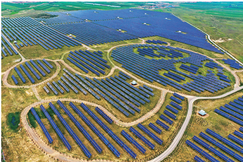
这是位于山西省大同市云州区杜庄乡土井村的以熊猫为造型的光伏电站(无人机照片,2021年8月3日摄)。