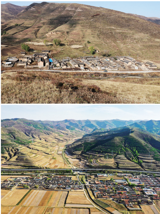
拼版照片:上图为山西省忻州市崞县宋家沟村村民在整村搬迁前居住的房屋(资料照片);下图为2020年5月9日拍摄的山西省忻州市崞县宋家沟村(无人机照片)。

党的十八大以来,习近平总书记三次到山西考察调研,为山西发展指明前进方向。牢记习近平总书记“希望山西在转型发展上率先蹚出一条新路来”“在高质量发展上不断取得新突破”殷殷嘱托,山西锚定转型发展不松劲,在爬坡过坎中奋力前行。