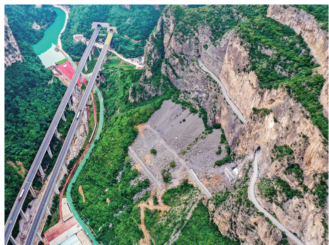
这是通过山西省长治市平顺县虹梯乡的高速公路(画面左侧),一旁是过去的“挂壁公路”(画面右侧)(2022年7月5日摄,无人机照片)。