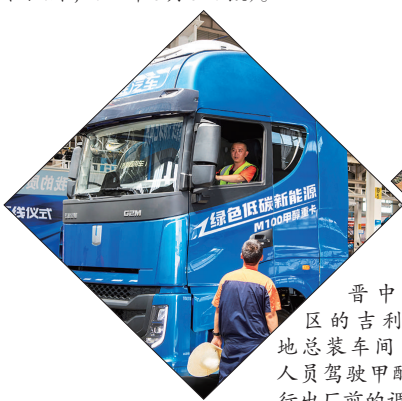
晋中市榆次区的吉利晋中基地总装车间内,工作人员驾驶甲醇汽车进行出厂前的调试。